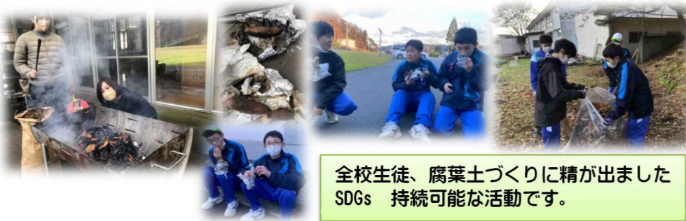
全校生徒、腐葉土づくりに精が出ました SDGs 持続可能な活動です。