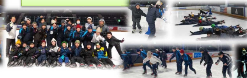
フラット八戸でのスケート授業

11月24日、創立70周年記念事業に向けての会議が開かれました。令和6年度に記念式典開催予定です。令和5年度から本格的に組織づくりが始まります。