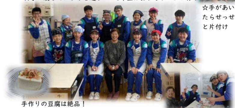
手作りの豆腐は絶品! ありがとうございます!