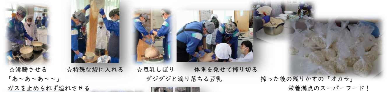
☆沸騰させる ☆特殊な袋に入れる ☆豆乳しぼり 体重を乗せて搾り切る 「あ〜あ〜あ〜」 ダジダジと滴り落ちる豆乳 搾った後の残りの「オカラ」 ガスを止められず溢れさせる 栄養満点のスーパーフード!

2月15日(水)2年ぶりに豆腐作り実習ができました。1,2年生が協力して一晩水に浸した大豆をミキサーで砕くことから作業し始めました。数班に分かれ砕く・ゆでる・絞る・型に入れる・切る・薬味準備・片付けるなど役割分担し、生徒にとっては初めての豆腐づくりをしました。長牛さんは30年以上前から本校生徒のために講師に来てくださっています。また来年度もよろしくお願いいたします。