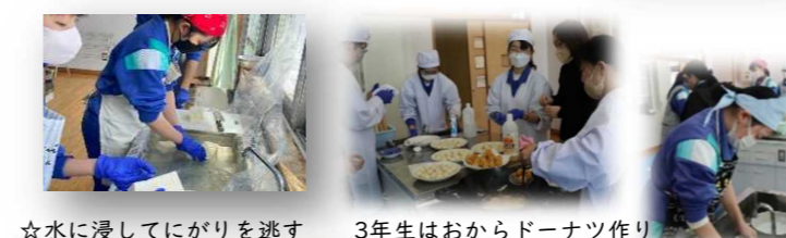
☆水に浸してにがりを逃す 3年生はおからドーナツ作り ☆手があいたらせっせと片付け