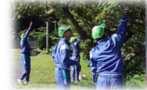
豊中門付近の梅とりを1年生に伝授する絵文