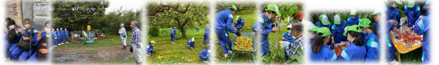
南部町諏訪ノ平駅下車 西館農園へ 木が病気になるぬよう落ちた梅を拾う、集める サクランボのとり方伝授 50パック以上できました

7/1 「出来たものを食べるだけでなく、収穫しパック詰めする過程」を学習しました。