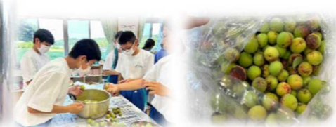
梅ジュースと梅ジャム製造

月初めの木曜日は学校奉仕活動です。7/6は環境委員の保護者も来校し、玄関前の花壇の手入れをしてくださいました。次回は8月3日。9時から環境整備が行われます。多くの方のボランティアをお待ちしております。