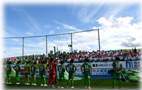
ヴァンラーレ八戸 スクールトリップデイ