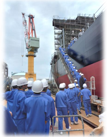
北日本造船 企業訪問